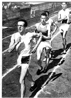
Die wenigsten würden sich bewusst sein, was es heisst, eine Grossveranstaltung wie die Juniorenmeisterschaften und den Leichtathletikwettkampf der Nationalmannschaften A und B in Bern auf eigenes Risiko zu unternehmen und damit auf eigenen Schultern einen Dienst an der Gemeinschaft zu leisten. Es geht nicht nur um Finanzziele, es geht um vieles mehr, um sportliche Ausbildung, gesundes Volk und hoffungsvolle Jungmannschaften. Die GGB hat es wieder einmal übernommen für eine Sache, die uns alle angeht, zu kämpfen und sie durchzuführen, und zwar in einer Weise, welche allgemeine Achtung und Anerkennung gefan-