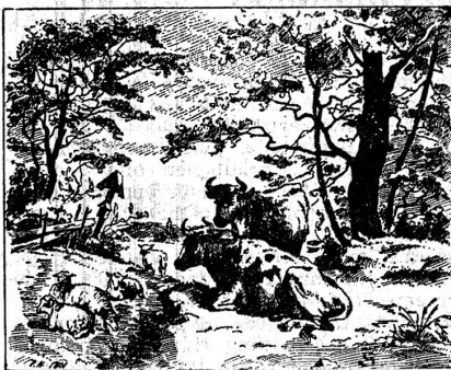
« Wo ist der Junge, der die Kühe und Schafe beaufsichtigt? »

Gewissermassen als scherzhafte Einzelfrage traf man ebensooft wie das Bilderrätsel — den sogenannten Rebus — auch das Vexierbild .