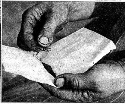
Bild links: Für einen Franken erhält man ungefähr soviel Safran wie auf der Waagschale liegt. Ein alter Spruch heisst, dass Safran mit Silber aufgewogen werde, also gleiches Gewicht Silber, gleiches Gewicht Safran. Bild rechts: Vor dem Verwenden legt man ein paar Fäden in ein Seidenpapier auf den Deckel des Kochtopfes, wo sie geröstet werden. Dann lassen sie sich leicht zu Pulver verreiben. Ein paar „Fäden“ reichen für den schönsten Risotto

des 14. Jahrhunderts in Basel sogar sehr intensiv, so dass der Rat ein Ausfuhrverbot der Safranzwiebeln erliess, um das Geschäft zu lokalisieren. Eben, das Geschäft! Denn das ist, neben häufiger Pilzkrankungen der Knollen, wohl der Hauptgrund, warum der Anbau dem ewig rechnenden Schweizer nicht mehr lohnend erschien.