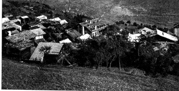
Einzig im Oberwalliserdörfchen Mund wird in der Schweiz Safran angebaut (Nr. 7473 BRB. 3 10. 39.)

Bild rechts: Eine Safranblüte: Sie blüht im Herbst, und ist violett. Als Safran werden ausschliesslich die Blütennarben (auf dem Bilde die herabhängenden Fäden) verwendet. Bild rechts aussen: 100 000 Blüten ergeben 1 kg Safran. Das gibt krumme Rücken, aber es lohnt sich, denn eine Familie verdient etwa 1000 Franken