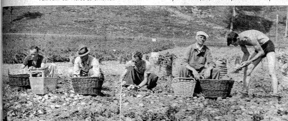
Der Boden dieses ehemaligen Sumpfgeländes scheint sich gut zum Kartoffelbau zu eignen. Viele und schöne Kartoffeln, das ist wichtig! Auflösen und sortieren, so lernt man auch die Kartoffeln näher kennen