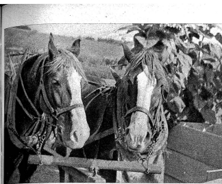
Der Selhofenbauer gönnt seinen schönen Pferden nach jeder ausgefahrenen Umdrehung eine kleine Pause. Die Pferde können einen Moment ruhen, die Männer aber während dieser Zeit Gelegenheit, die ausgemachten Kartoffeln aus der Fahrbahn der Pferde zu entfernen