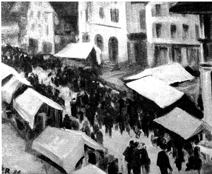
„Loupemärit“, Original von E. Ruprecht

kehr wieder erschlossen worden. Gewerbe und Handel haben sich gehoben und die Industrie hat Einzug gehalten. Wohlstand verbreitete sich, und das Sensetal ist heute ein Gebiet, aus welchem der Staat Bern beträchtliche Steuereinkünfte bezieht.