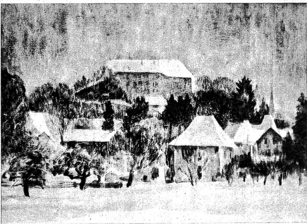
Laupen im Schnee von E. Ruprecht

«Du wirst ihn Meister Le Roux persönlich übergeben», befahl sie mir, «und auf Antwort warten.»