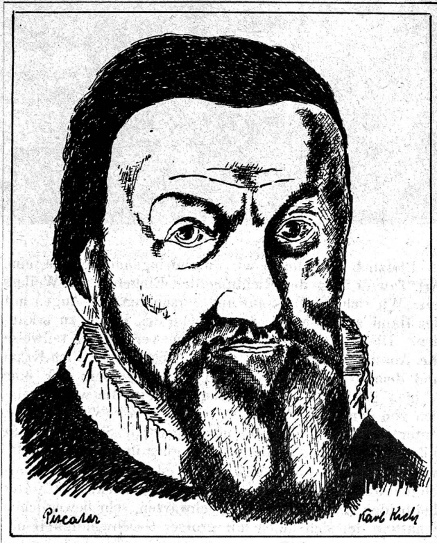
Piscator, nach einem Gemälde in der Universität Bern

«Getrukt wurde sie zu Bärn in der hoch Oberkeitlichen Trukerey durch Andreas Hugenet» in den Jahren 1683 und 1684; von den 6099 Büchern, die damals gedruckt wurden, sind ausser einem Exemplar auf der Stadtbibliothek zu Bern, und einem in der Kirche Wilderswil, nur noch wenige am Leben. Ihre Entstehung verdankt die Bibel der Starrköpfigkeit und prozessionsartigen Langsamkeit des alten mächtigen Bern. Bis 1660 wurden im Bernerland unzählige Lutherbibeln gebraucht. Daher mag sich erklären, dass in jenem Jahre die Geistlichkeit und der hohe Rat von Zürich den kirchlichen und staatlichen Behörden von Bern den Vorschlag machten, gemeinsam mit ihnen, die seit Reformationszeiten in Zürich gültige Uebersetzung der Heiligen Schrift neu drucken zu lassen. Gewiss hoffte Zürich damit eine gemeinsame Bibel für die reformierten Orte der