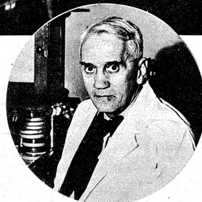
Prof. Dr. Alexander Fleming, der Erfinder des Penicillins, wurde für seine Verdienste vom englischen König in den Adelsstand erhoben. Die Meldung, wonach er den Nobelpreis für Medizin erhalte, hat sich indessen nicht bestätigt

Die Penicillinfabrikation umfasste im März dieses Jahres nicht weniger als 40 Milliarden Oxford-Einheiten gegenüber 400 Millionen Einheiten für das erste Halb-