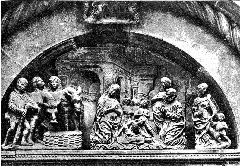
Geburt und Anbetung Christi am Dom zu Como von Tomaso Rodari