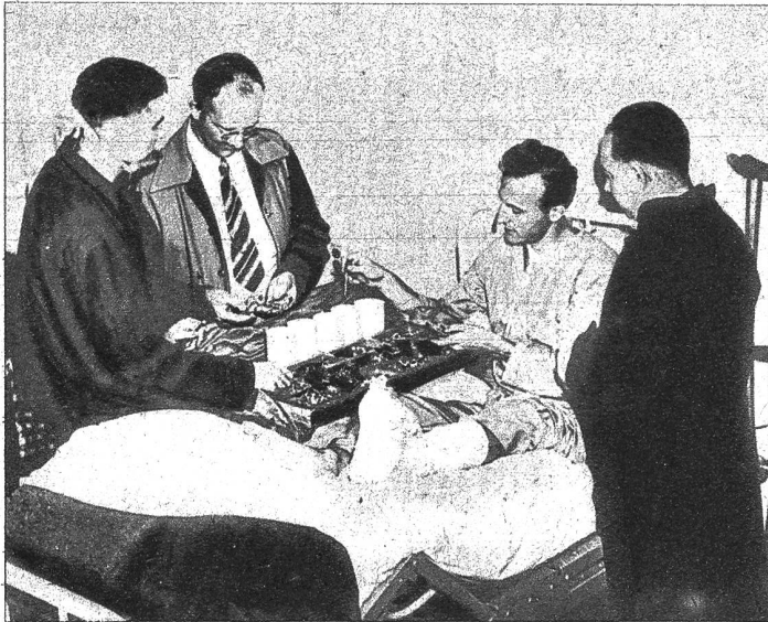
Dieser Kriegsverletzte war Instrumentenmacher. In diesem Spital erhält er von einem Spezialkrankenlager aus die Gelegenheit, sich in seinem Beruf weiterzubilden

Immer noch begegnet man Menschen, denen der letzte Weltkrieg ein furchtbares Los aufgebürdet hat. Als Krüppel von der Front zurückgekehrt, fanden viele von ihnen irgendwo ein Gnadenbrot, das sie sich als nicht mehr vollwertige Menschen fast erbetteln mussten. Noch lässt uns die Erscheinung eines Orgelmannes oder eines Strassensängers an das bittere Los aller derjenigen denken, die, im letzten Krieg zum Krüppel geworden, nie keine richtige Arbeitsstätte finden konnten. —