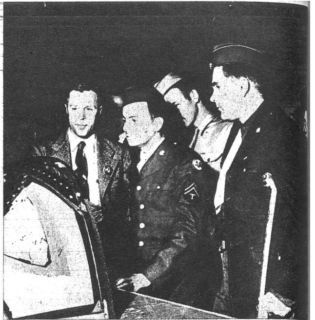
Verletzte Piloten der RAF. möchten in irgend einer Weise dem Flug treu bleiben. Sie werden nun zu Flugzeugmechanikern ausgebildet

Dies zu verhüten, ihnen ihr Schicksal tragen zu helfen, und ihnen wieder vollwertige Menschen zu machen, zählt wohl zur humaneren Aufgabe eines kriegführenden Volkes. Amerika hat zu diesem Zwecke in Kalifornien eines der grössten Spitäler der Welt eröffnet, das nicht nur für die Heilung der Kriegsverletzten sorgt, sondern das ihnen sogar Gelegenheit bietet, freiwillig einen neuen Beruf zu erlernen, der ihnen, je nach ihrer Konstitution, im späteren Leben eine Existenzmöglichkeit bieten soll. Spital und Schule haben sich so zu einer Gemeinschaft zusammengeschlossen, die in grosszügiger Weise für die Patienten sorgt und diese Aufgabe unentgeltlich erfüllt. « Birmingham General Hospital » in Kalifornien, das mehr als tausend Kriegsverletzte zu betreuen vermag, hat in moralischer Hinsicht für die Patienten sicher den richtigen Weg gewiesen. Möge der Geist dieser Institution und die Früchte ihrer Arbeit den vielen Kriegsverletzten helfen, ihr schweres Los leichter zu ertragen und einer gesicherten Zukunft entgegen zu gehen.