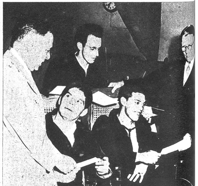
Nach Absolvierung einer Prüfung erhalten die Kriegsverletzten ein Diplom, das ihnen im Leben draussen als gute Referenz dienen soll

Dies zu verhüten, ihnen ihr Schicksal tragen zu helfen, und ihnen wieder vollwertige Menschen zu machen, zählt wohl zur humaneren Aufgabe eines kriegführenden Volkes. Amerika hat zu diesem Zwecke in Kalifornien eines der grössten Spitäler der Welt eröffnet, das nicht nur für die Heilung der Kriegsverletzten sorgt, sondern das ihnen sogar Gelegenheit bietet, freiwillig einen neuen Beruf zu erlernen, der ihnen, je nach ihrer Konstitution, im späteren Leben eine Existenzmöglichkeit bieten soll. Spital und Schule haben sich so zu einer Gemeinschaft zusammengeschlossen, die in grosszügiger Weise für die Patienten sorgt und diese Aufgabe unentgeltlich erfüllt. « Birmingham General Hospital » in Kalifornien, das mehr als tausend Kriegsverletzte zu betreuen vermag, hat in moralischer Hinsicht für die Patienten sicher den richtigen Weg gewiesen. Möge der Geist dieser Institution und die Früchte ihrer Arbeit den vielen Kriegsverletzten helfen, ihr schweres Los leichter zu ertragen und einer gesicherten Zukunft entgegen zu gehen.