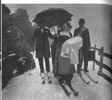
Die Taufpartie auf dem Weg zum Schlitten. Die hübsche „Gotte“ in Bernertracht hält im linken Arm das Kind, in der rechten Hand den Skistock. Rechts von ihr der Pseudo-Götti mit Kofferchen, wie es Brauch und Sitte ist, links der „Vatter“