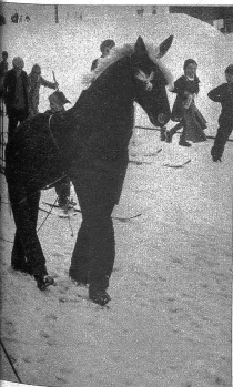
Links Mitte: Holt am Ziel. Die letzte kurze Strecke bis Wengen-Dorf wird „im Schuss“ zurückgelegt, was dem Esel wenig zu behagen scheint. Links: Endlich am Ziel. Das ganze Dorf ist auf den Beinen, um sich an der seltsamen Taufpartie zu belustigen. Die Kurgäste scheinen ein besonderes Vergnügen am Wengener Brauch zu haben. Rechts: Der Photoreporter ist ihr beständig auf den Fersen. Sie scheint darob nicht besonders entzückt zu sein. Wie soll man „bitte, recht freundlich“ dresbücken, wenn man auf Brettern steht und dazu noch ein Kind im Arme hat? Machen Sie es der „Gotte“ gleich! Nach Reportage: ILLUSTRATION