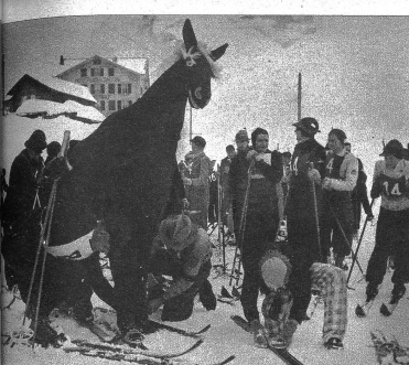
Das „Pferd“ wird „angeschirrt“. In der Haut des seltsamen Esels stecken natürlich zwei waschechte Wengener Burschen, beide geübte Skifahrer