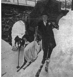
Oben: „Gotte“ und „Götti“, mit ihrem Taufkind. Die hübsche Berner Oberländerin scheint besonders gut in ihre Rolle eingelebt zu haben. Links: Ein Hindernis. Es blieb der Taufpartie nichts anderes übrig, als auszustiegen und die kleine Strecke auf Brettern zurückzulegen, denn der Gaul weigerte sich hartnäckig, diese kleine Steigung zu nehmen. Unten links: Unterwegs macht die Gesellschaft einen kurzen Rast zur Stärkung von Leib und Seele

Eigentlich sollte es heissen: ein tolles Spiel zum Zeitvertreib. Oder: Mummenschanz im Schnee. Denn das Kind, das zur Taufe geführt wird, ist kein Baby aus Fleisch und Blut, sondern eine Puppe aus Holz und Stoff. Und in der Haut des Esels, der während der tollen Fahrt die lustigsten Kapriolen ausführt, stecken zwei waschechte Wengener Burschen, die sich ein Vergnügen daraus machen, die « tierischen » Charaktereigenschaften des Esels so menschenähnlich wie nur möglich zum Ausdruck zu bringen.