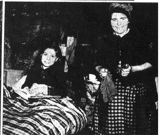
Oben: Während die Mutter mit dem Flicker der Strümpfe beschäftigt ist, sitzt ihr Töchterchen im warmen Bett und liest in seinem Schul-Lesebuch