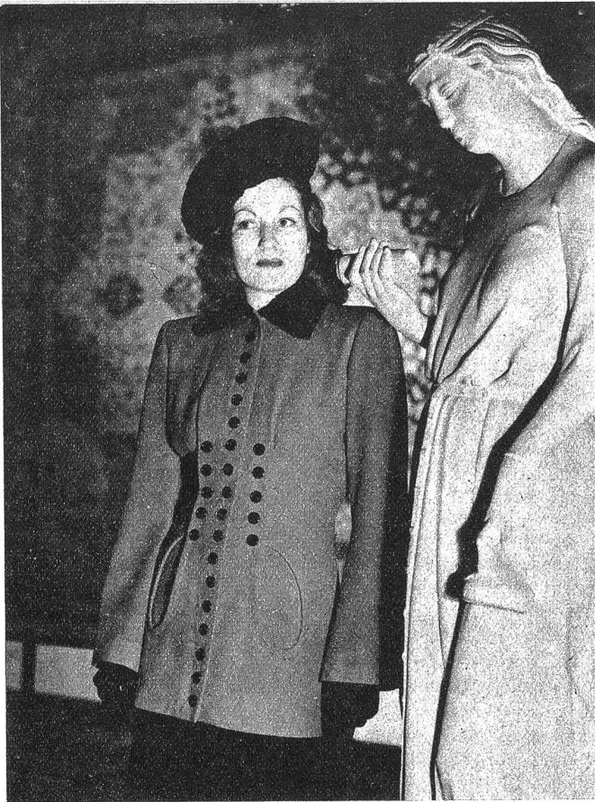
Elegante Jacke für den Frühlingsanfang. Diese kann leicht aus einem alten Mantel angefertigt werden

Medizin. Ganz deutlich entsann sie sich noch seiner Antwort: „Weil Musik kein Beruf ist“, hatte er gesagt. „Es kann einem Freude machen, irgendeinen Banausen von einer doppelseitigen Lungenentzündung zu heilen. Aber ihm die „Eroica“ vorspielen — nein!“ So heilig waren ihm die Dinge. Und jetzt? ... Zu den Australnegern würde er sein geliebtes Klavier nicht mitnehmen können — — —