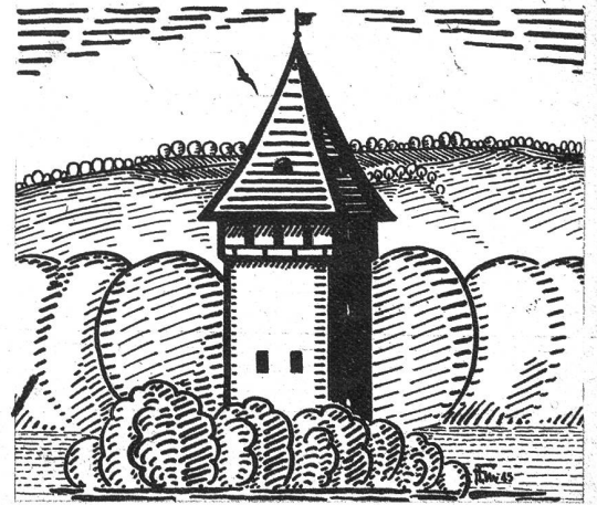
Der Lombachturm an der Laupenstrasse (1783)

Der Lombachturm ist von der Bildfläche verschwunden, geblieben ist sein Fundament und der Name Turmau, Laupenstrasse 41. Die Laupenstrasse, eine alte Heer- und Handelsstrasse, ist eine der