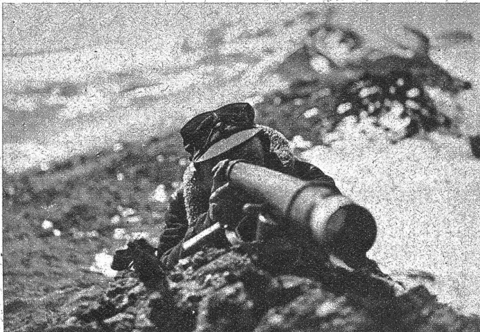
Der Beobachtungsposten auf der „Takeheimen“-Station. Diese erhielt ihren Namen, weil hier fast immer Nebel herrscht, selbst wenn auf dem übrigen Teil der Insel die Sonne scheint

Die Funkerhütte. Von ihr aus werden viele der wichtigsten Wetterberichte an die meteorologischen Stationen telegraphiert. Das Klima ist rau, und um die Hütte warm zu halten, mussten Sandsäcke, Steine und Erde längs den Mauern aufgeschichtet werden