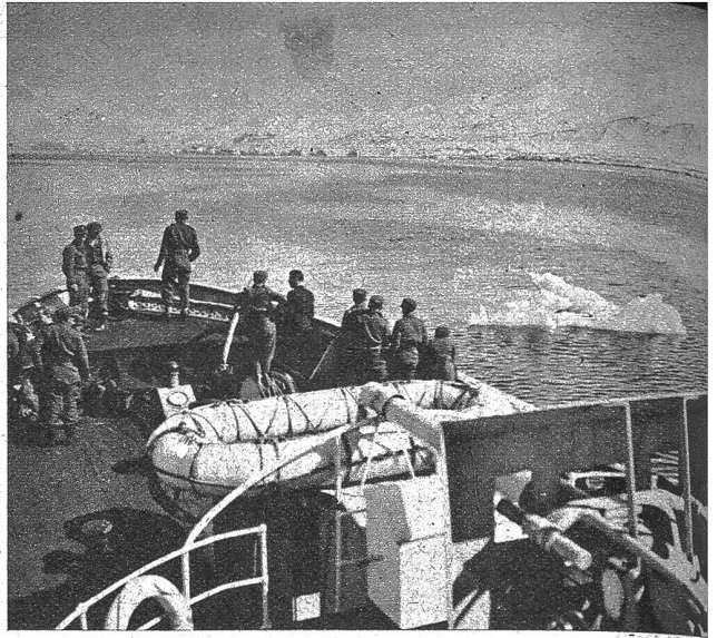
Das norwegische Patrouillenschiff „Namsos“, das vor dem Krieges grösste Walfischfängerschiff der Welt gewesen ist, bringt eine Ablösung nach der Insel