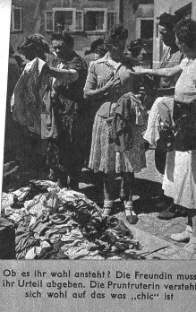
Ob es ihr wohl ansteht? Die Freundin muss ihr Urteil abgeben. Die Pruntruterin versteht sich wohl auf das was „chic“ ist