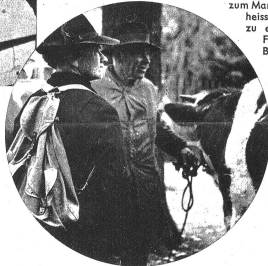
Eine von den Vielen, mit dem Rucksack, in dem alle notwendigen Einkäufe verborgen werden. Sie hat einen Dorfgenossen getroffen, mit dem sie sich über das Markt- leben unterhält