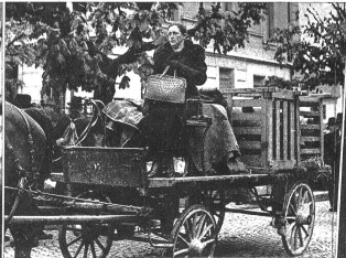
Der zweite Platz ist noch leer. Die Bäuerin hat Ein- käufe besorgt — noch fehlt der Gemahl, der irgendwo in einer der Wirtschaften einen guten Kauf feiern mag