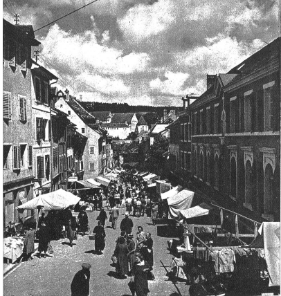
Die beiden Hauptgassenzüge in Pruntrut, die vom Hügel der Oberstadt nach der Unterstadt hinabsteigen, geben beide den Blick nach dem breit- hingelagerten bischöflichen Schlosse frei. So steht das Marktleben wie früher noch unter den Augen eines herrschaftlichen Baues