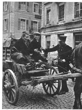
Ob das Bauerngefahr! soeben zum Markt kommt? Offenbar heisst es jetzt eine Gebühr zu entrichten, was die Frau besorgt, die den Beutel führt