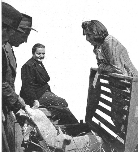
Unten: Heute wertvoller als je, ist diese Markt- ware denn auch begehrt, besonders wenn sie zum Verspeisen zubereitet auf dem Teller liegt. „Was mögen die Bauern für meine Lieblinge wohl bieten wollen?“ denkt die junge Elsguerierin mit dem lebensfrohen Blick