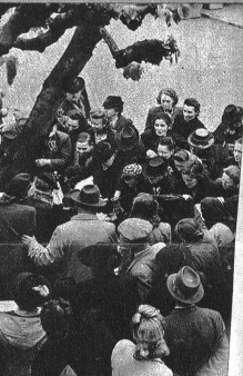
Was wird da wohl Wertvolles oder Rares feil- geboten? Der „Billige Jakob“ weiss die Leute mit allerlei lustigen Sprüchen anzulocken