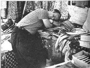
Kleine Pause am Verkaufstand

diesem Monatsmarkt vertreten, alles ist käuflich und kommt an den Mann und vieles natürlich an die Frau.