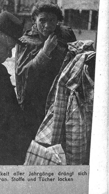
Weiblichkeit aller Jahrgänge drängt sich heran. Stoffe und Tücher locken