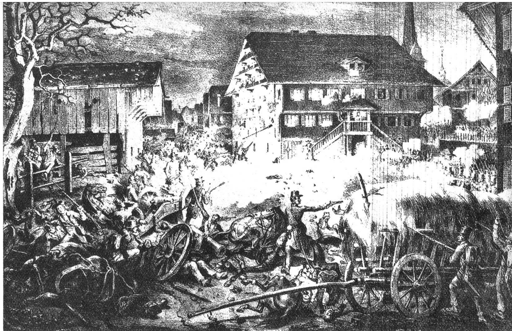
Treffen im Dorfe zu Malters. Gänzliche Niederlage der Freischaren durch eine Abteilung Luzerner- truppen in der Nacht vom 1. April 1845

So endete auch der zweite Freischaren- zug am 2. April 1845 mit einer Niederlage der Liberalen.