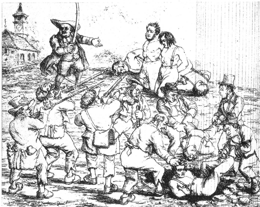
Massakrierung und Ausplünderung der Gefangenen unter dem Kommando des Pfarrers von Neukirch