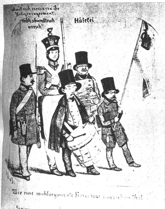
Gottfried Keller als Tambour der zürcherischen Freischärler