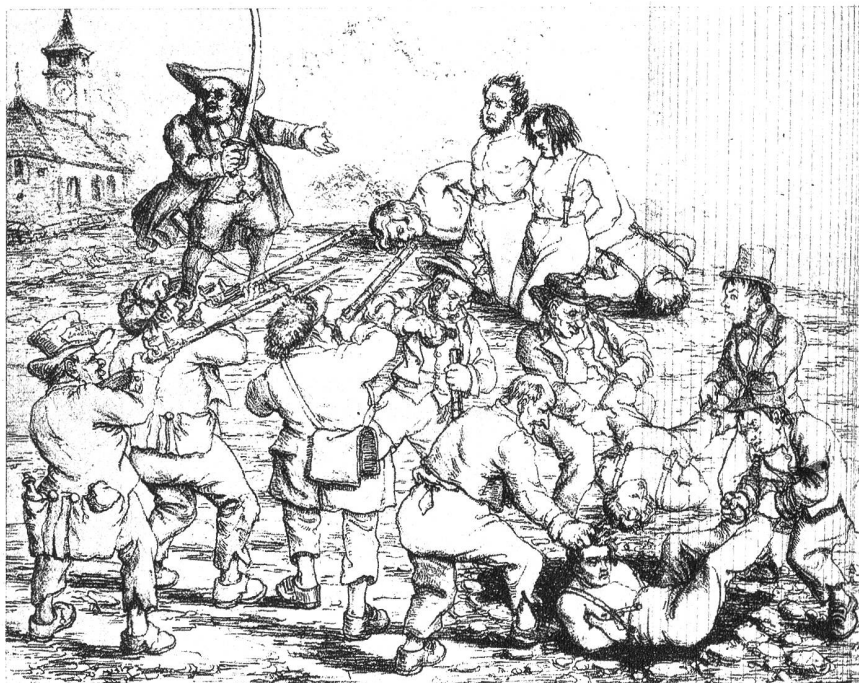
Massakrierung und Ausplünderung der Gefangenen unter dem Kommando des Pfarrers von Neukirch