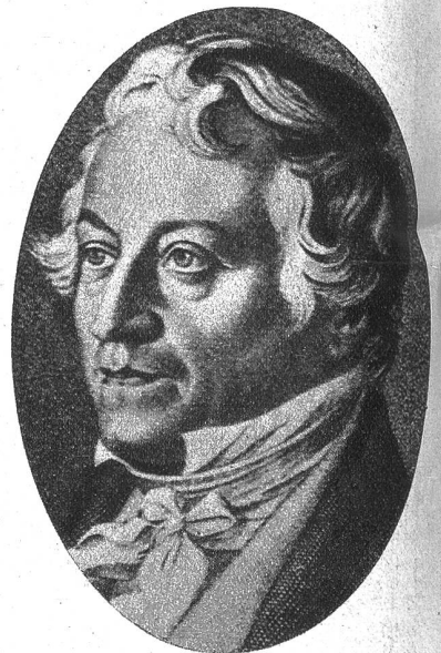
Dr. Robert Steiger, das geistige Haupt der Freischarenzüge

Am 30. März 1845 setzten sich die Frei-scharenzüge in Bewegung. Es kam zu ei-nem Gefecht bei Littau und zu einem Scheinangriff auf die Emmenbrücke. Die Freischaren rückten bis vor die Tore Lu-zerns, und in der Stadt glaubte man an eine verlorene Sache. In diesem Augen-