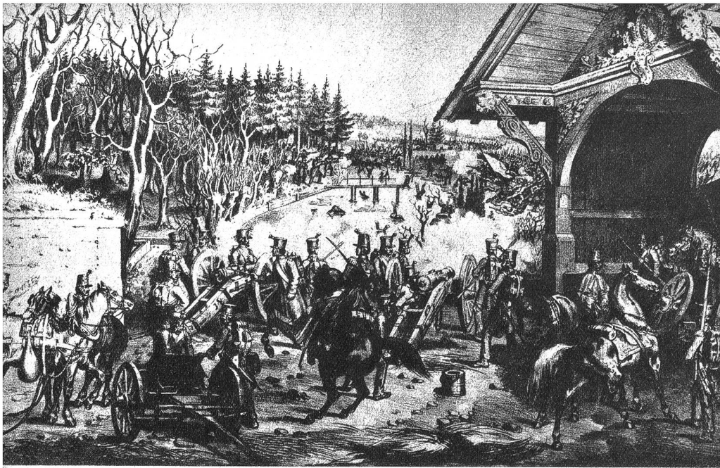
Treffen und Niederlage der Freischaren am Emmenfelde durch die Luzernertruppen und eine Abteilung von Unterwalden am 31. März 1845, abends zwischen 4 bis 6 Uhr