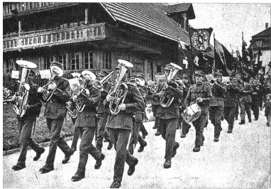
Das Ter. Bat.-Spiel. Die meisten dieser „Territorialen“ haben daheim selber Kinder und Schüler... Es war für sie ein grosses Vergnügen, der Dorfjugend eine ganz besondere Freude zu bereiten!