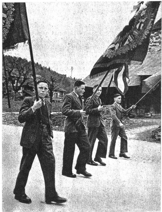
Vier stramme Neuntklässler führen den Umzug an

Rechts: Ich bin ein Schweizerknebe! Jeder Dorfjunge sichert sich oft schon Wochen vor dem Examen bei Bekannten oder Verwandten eine Fahne