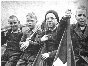
Waschechte Erstklässler vor dem Umzug in Erwartung der Ereignisse