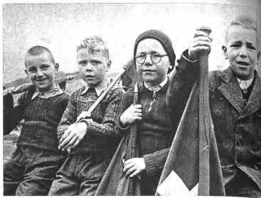
Waschechte Erstklässler vor dem Umzug in Erwartung der Ereignisse