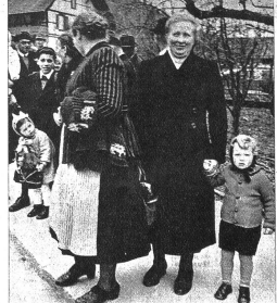
Mütter mit dem Nachwuchs, bereit, das Defilee abzunehmen