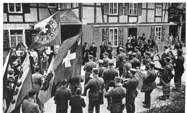
Die einzige Dorfwirtschaft ist bereit! Denn nach dem Umzug dürfen die Schüler im Saal einige Tänzein probieren, wobei es einzig auf die damit verbundene Freude ankommt. Dazwischen schallen die munteren Lieder der Klassen und ergänzen allfällige Kurzaufführungen