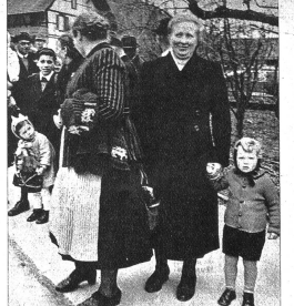
Mütter mit dem Nachwuchs, bereit, das Defilee abzunehmen