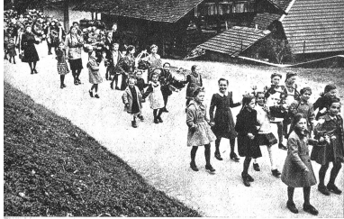
Die Mädchen mit den Blumenkörbchen und Kränzen, an denen zuhause mit vereinten Kräften Tegelung geschafft wird