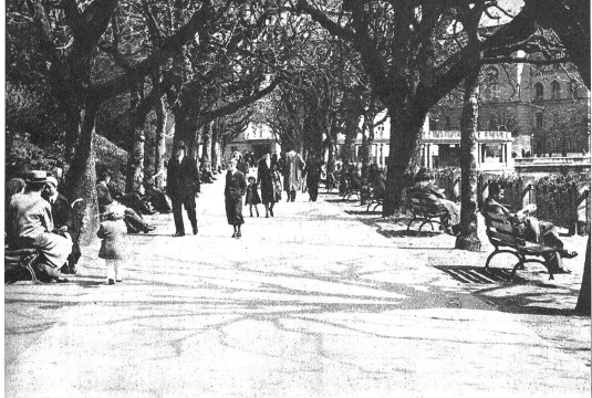
Kein Bankleier der Promenade ist frei...