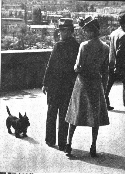
Sie, Er und ein Kowu-Hund

Das ist natürlich die Bundesterrasse und die Kleine Schanze in Bern.