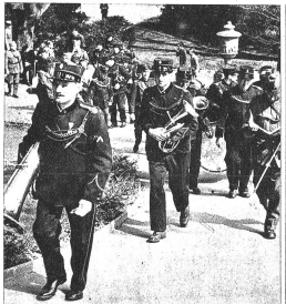
Links: Die Pestmusik kommt angezogen! Rechts: Und hinter der Musik kommen die Leute. Merkwürdig, jeder verspürt ein gehobenes Gefühl, auch wenn er hinter der nichtspielenden Musik hergehen kann...