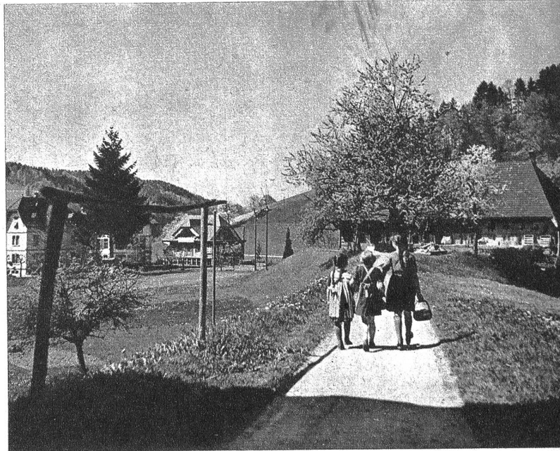
Huttwiler Mädchen auf dem Heimweg

Huttwil hat eine ziemlich ausgedehnte burgerliche Domäne, bestehend in Ackerland und Waldungen. Diese gehören sonderbarerweise zwei burgerlichen Organisationen, einer Herd- und einer Hofgemeinde, und deshalb gibt es auch Herd- und Hofburger. Die letztern haben keine Nutzniessung an dem burgerlichen Gut in natura, sondern nur am Burgergut in bar. Huttwil hat eine sehr interessante Lokalgeschichte und ist eine uralte Niederlassung, die wahrscheinlich schon in die Zeit der Römer zurück reicht. Erstmals wird sie in einer Urkunde des Klosters St. Gallen, das im Langetental Besitzungen hatte, um die Mitte des 9. Jahrhunderts unter dem Namen «Huttivilare» erwähnt. In einer zweiten Urkunde vom Jahr 1108 vernehmen wir, dass Huttwil an die Benediktinerabtei «St. Peter» im Schwarzwald verschenkt wurde. Ferner wird urkundlich erwähnt, dass 1185 die Benediktinerabtei «St. Johann» bei Ins im bernischen Seeland auch Besitzungen in Huttwil hatte. Es stand unter der Oberhoheit der Zähringer und kam nach deren Aussterben im Jahre 1218 unter die Herrschaft der Grafen von Kiburg; beide Klöster behielten aber ihre Besitzungen bis zur Reformation. Im 13. Jahrhundert wurde der bisher offene Ort durch den Bau von Mauern und Graben in eine «Stadt» umgewandelt.