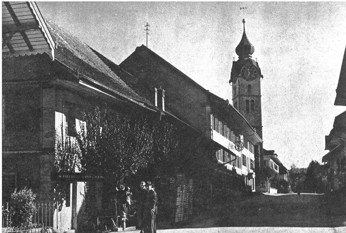
1 Die Marktgasse in Huttwil mit dem alten bestrenommierten Gasthof zum Mohren auf der linken Seite des Bildes. Vis-à-vis steht das 1933/34 neu erbaute, stilvolle Stadthaus mit sämtlichen Lokalen für die Gemeindeverwaltung. Im Erdgeschoss befindet sich das Restaurant zum Stadthaus, dessen Lokalitäten mit sämtlichen 37 Huttwilerbürgerwappen geschmückt sind