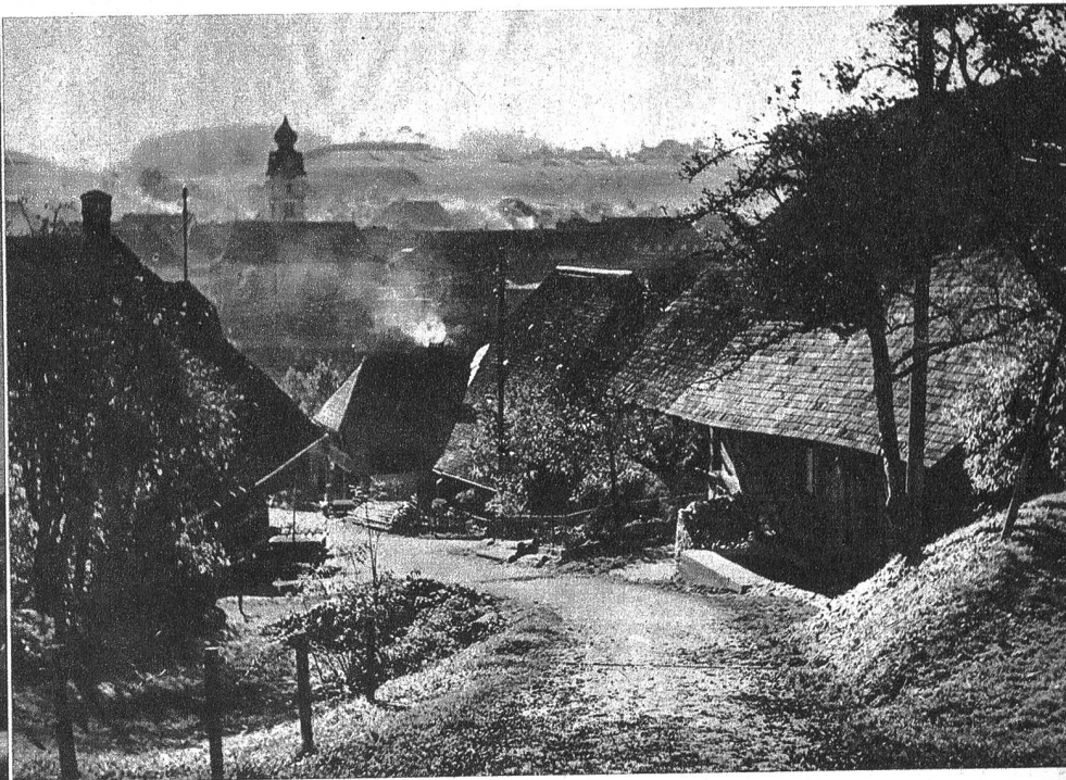
„Im Thomasboden“. Ein Stück Alt-Huttwil an der Peripherie der Ortschaft, hart am Südfuss des Huttwilberges, an dessen Südfuss hingehört die ganze Ortschaft hinzieht