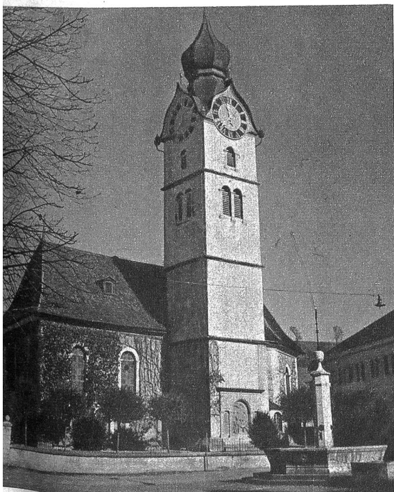
Die Kirche von Huttwil mit dem 1921 am Fuss des Turmes angebrachten Soldatendenkmal zur Erinnerung an die im Aktivdienst 1914—18 verstorbenen Wehrmänner. Vor der Kirche befindet sich der Brunnenplatz, auf dem sich der Markt, die Feste und Gedenkfeiern, sowie überhaupt ein grosser Teil des öffentlichen Lebens in Huttwil abspielt