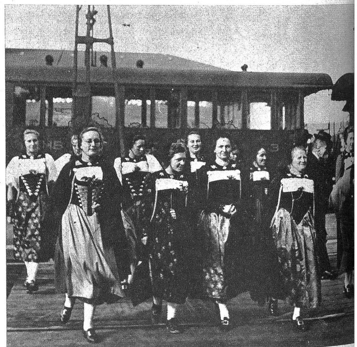
Huttwilerinnen in der schmecken Emmentalertracht. Zum freundlichen, heimeligen Stil des Emmentaler Bauernhauses gehört auch die anmutige Tracht der Frauen. Beides hält die Bevölkerung von Huttwil in hohen Ehren und wird durch die rege Tätigkeit der Trachtengruppe nach Kräften gefördert