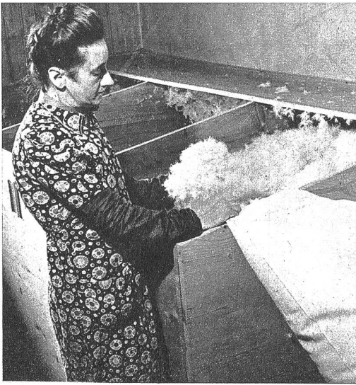
Ganz feiner Gänseflaum wird für ein Duvet abgefüllt