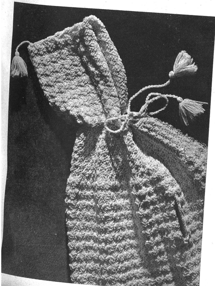
Rechts unten: Zwei hübsche, handgestrickte Anknöpfler