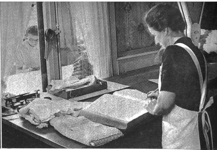
Materialkontrolle in der Fergerei