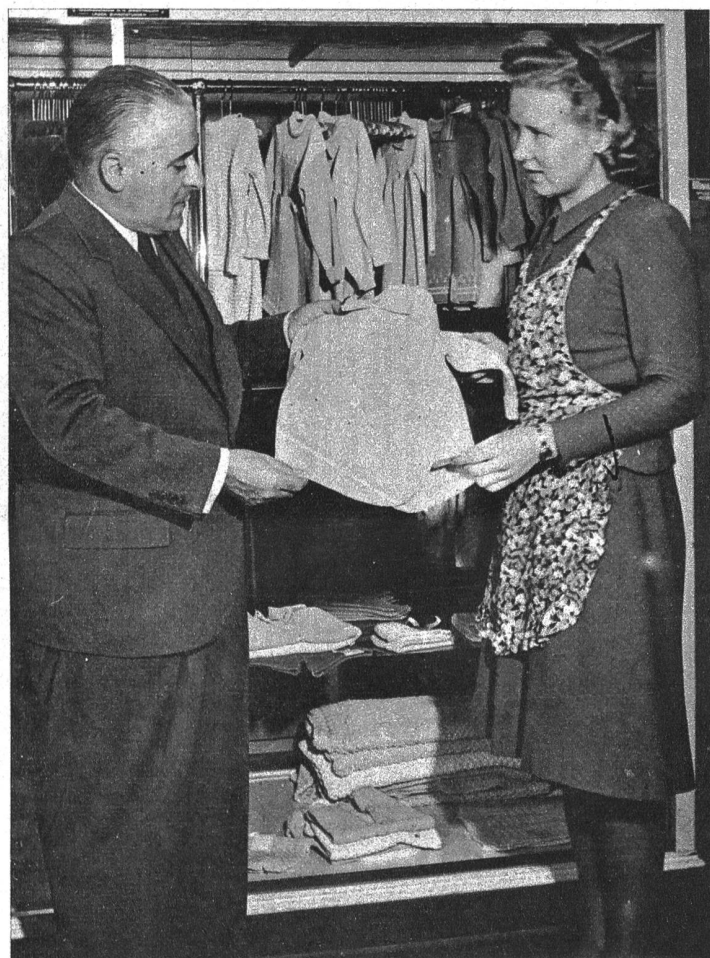
Vorlegen eines Modells aus dem Musterschrank