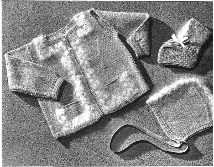
Rechts: Eine reizende handgestrickte Garnitur — Jäckli, Häubli und Finkli — verziert mit Angora

Für unsere Ortschaft aber spielt gerade dieser Erwerbs-zweig eine bedeutende Rolle.