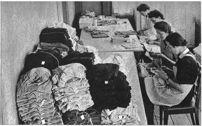
Konfektionieren der gestrickten Kinder- und Bébéartikel