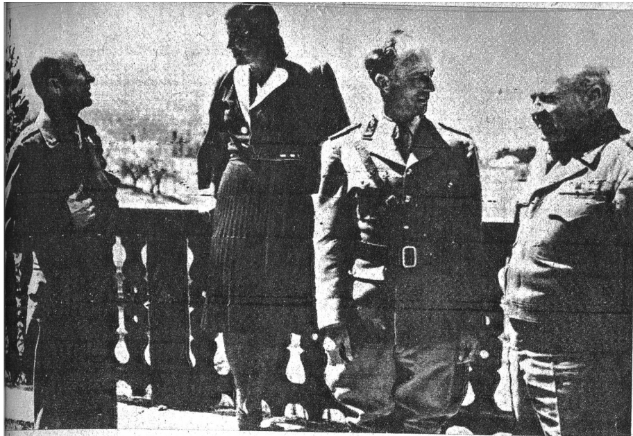
Im österreichischen Strobl haben amerikanische Truppen König Leopold von Belgien befreit, der hier erstmals wieder mit seiner Gattin vereint, sich in Gesellschaft zweier hoher amerikanischer Offiziere befindet