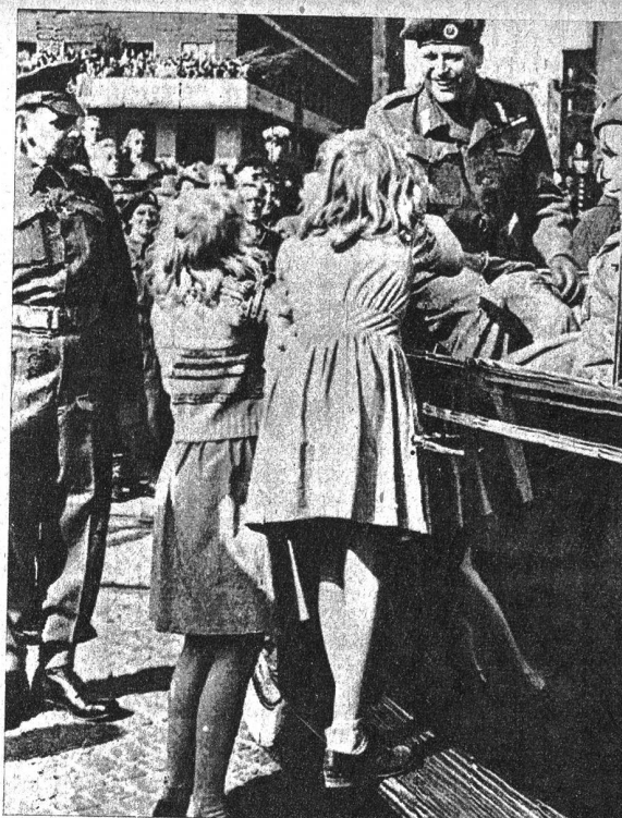
Rechts: Der norwegische Kronprinz Olaf ist nach langer Emigration nach Norwegen zurückgekehrt, wo er von der Bevölkerung stürmisch begrüßt und gefeiert wurde