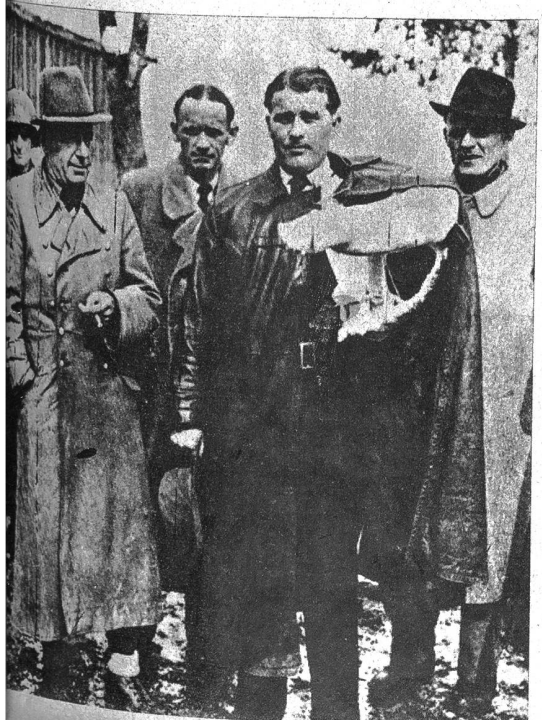
Links: Der Erfinder der Geheimwaffe V2, Prof. Wernther von Braun (mit dem Arm in der Schlinge) ist mit seinen wissenschaftlichen Mitarbeitern von der siebenten amerikanischen Armee gefangen genommen worden