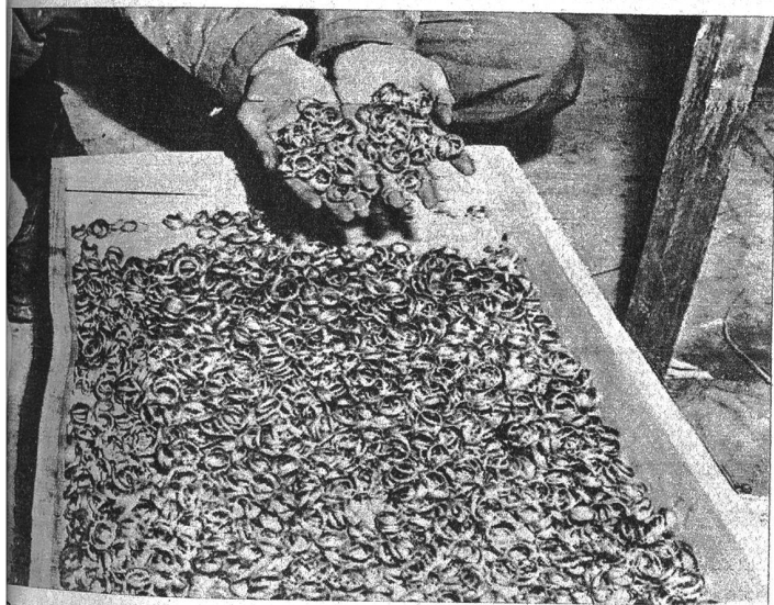
Dass in den Konzentrationslagern, in welchen die Gefangenen systematisch zu Tode gequält wurden, auch die Leichen beraubt wurden, ist selbstverständlich. Aber man bekommt doch einen Schreck, wenn man diese Berge von Eheringen betrachtet, welche jetzt die Alliierten aufgefunden haben, denn jeder Ring erzählt von einer grausamen Tragödie