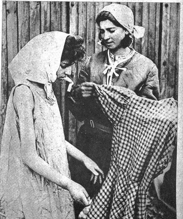
Rechts: Im Bezirk Lüneburg hat die britische Militärregierung angeordnet, dass jeder Deutsche — Männer, Frauen und Kinder — je einen kompletten Satz ihrer besten Kleidungsstücke, und zwar Schuhe, Unterwäsche Kleider, Mäntel und Hüte innert 24 Stunden abgeben muss. Auf diese Weise werden die Überlebenden des Konzentrationslagers Belsen-Bergen in die Lage versetzt, ihre Sträflingshemden abzulegen — die Deutschen dürfen sie haben — und sich menschenwürdig zu kleiden. Wie unser Bild zeigt, bedarf es ausserdem auch einer ausgewählten, kraftvollen Nahrung, um die von ihren Torturen schwer mitgenommenen Konzentrationslager-Opfer wieder zu Kräften zu bringen