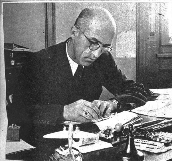
Die Geschäftsleitung ist die treibende Kraft im Betriebe

B ei allen Problemen, Versuchen und Arbeiten, die das Unternehmen Electro-Norm AG. Murten beschäftigt haben, ging es immer darum, die wertvolle Substanz, die bisher im allgemeinen als verloren galt, zu gewinnen und zu erhalten. Alle Instrumente und Apparate, die aus den Werkstätten und Laboratorien der Firma hervorgingen, haben dank dieses Arbeitsprinzips der Erhaltung der wertvollen Substanz einen vollen Erfolg dokumentiert.