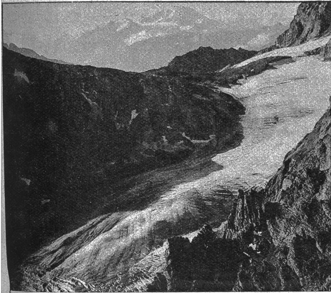
Am Lötchenpass bei Kandersteg Zens. 1709.

tische Erkenntnisse aus der Handschrift. Unter Vermeidung lehrhafter Theorie und Systematik wird anhand vieler Schriftproben gezeigt, wie sich eine Anzahl im menschlichen Verkehr bedeutungsvolle Eigenschaften in der Handschrift äussern. In klaren, kurzen Zusammenfassungen werden nach erläuternder Besprechung alle wichtigen Merkmale für das grundlegende Erkennen von Ausdauer, Verträglichkeit, Geselligkeit, Temperament, Energie, Intelligenz und Unaufrichtigkeit zu einem praktischen Schlüssel geformt. Es ist wohl die einzige für den Laien verfasste graphologische Schrift, die in so einfacher Weise absolut Brauchbares ohne jeden Verstoß gegen die Wissenschaft bietet.