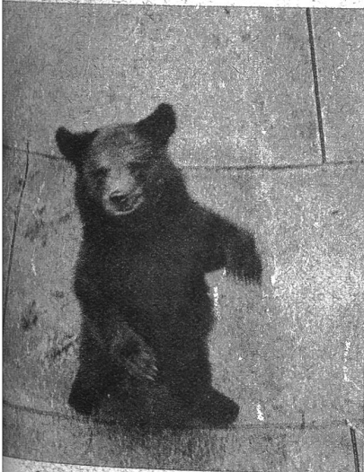
Bin ich nicht ein drolliger Kerl?