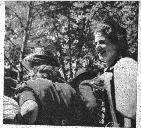
Auch diese schicke Bernerin betrachtet die jungen Bären mit Vergnügen