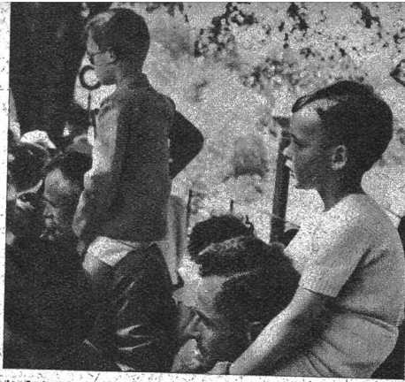
Auf des Vaters Buckel sitzend, kann man gut dem fröhlichen Treiben der Bären zusehen

Ja, man muss es spüren, wie die Bären ihre Beschauer zu fesseln wissen, und gegenwärtig haben die Jungen,