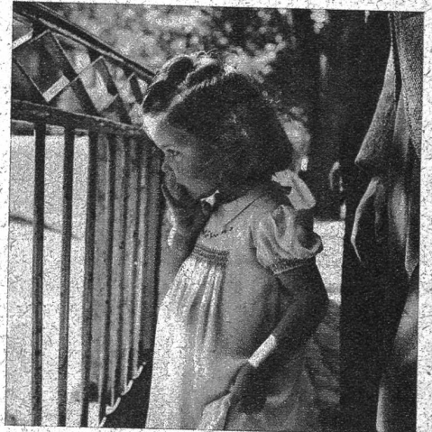
Ganz vertieft schaut diese Kleine den tollen Sprüngen zu

und Not den Kopf über dem Wasser halten kann und schüchtern die ersten Schwimmversuche unternimmt. Es geht häb chläh, aber nun hilft ihm die Mutter wieder hinaus, packt es mit der Schnauze am schmucken, weissen Krägelchen, hilft mit den schweren, breiten Tatzen nach, und nun sitzt das Kleine wieder an der Sonne; pudelnass zwar und ohne grosse Begeisterung für das unwillkommene Bad.