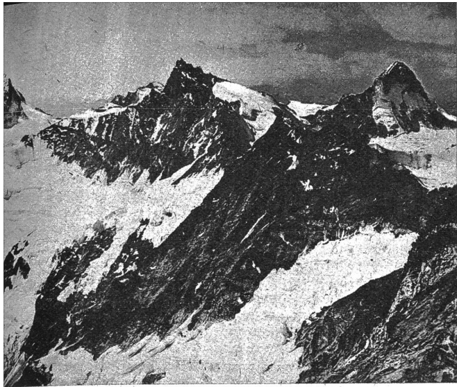
Die Aussicht vom Weisshorn-Ostgrat aus auf das Matterhorn, das Zinalrothorn und die Dent Blanche