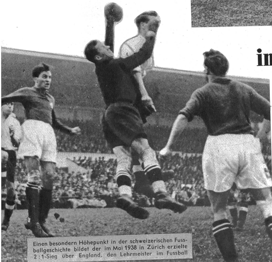
Einen besondern Höhepunkt in der schweizerischen Fussballgeschichte bildet der im Mai 1938 in Zürich erzielte 2:1-Sieg über England, den Lehrmeister im Fussball