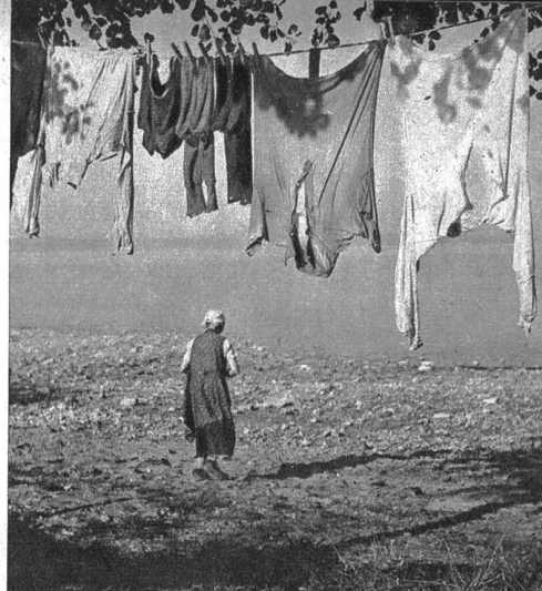
Auf dem Weg zum grossen Spülbecken