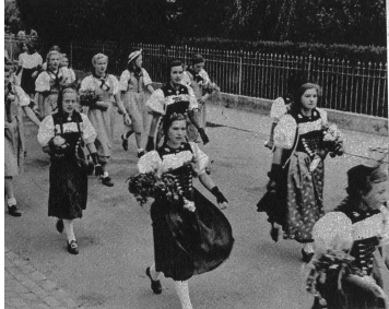
Trachtengruppe im Umzug