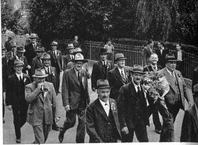
Die Ehrengäste im Festumzug