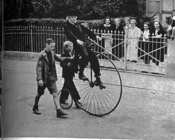
Die fröhliche Gruppe, die gute alte Zeit darstellend, im Umzug