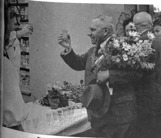
Ein Festtrunk am Bahnhof Huttwil