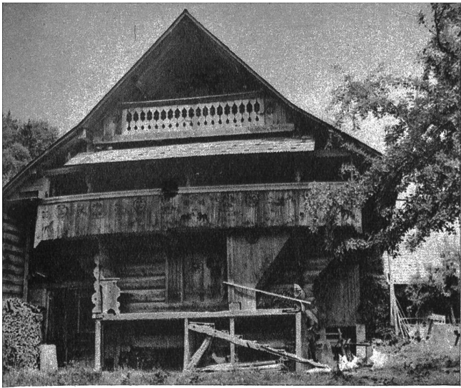
Links: Alter Speicher aus der Umgebung von Huttwil