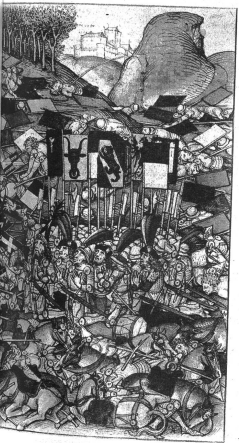
Höhepunkt der Laupenschlacht

Links: Das Gebet auf dem Schlachtfeld nach der Laupenschlacht. „Der almächtig got so gnädig wes gewesen, das ie ir einer der vyenden zehen überunden hattend; darumb si got lopten und im dankend mit bezzen und mit munde, der si so erbarmen herzlich erlöst hat und von grosser not entpunden.“ Dies alles berichtet uns der Chronist in selbstbewusstem Stolz, eine der grössten Kriegstaten der Berner zu ewigem Gedächtnis aufzuzeichnen.