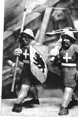
Zwei wackere Kriegerheute der bernischen Streitmacht

Soweit der nüchterne Geschichtsschreiber. Die Schillingchronik aber mit ihren lebendigen Darstellungen und unmittelbarem Erzählertext ist weit anregender, erfrischender und vermag vor allem auch den Künstler anzuregen.