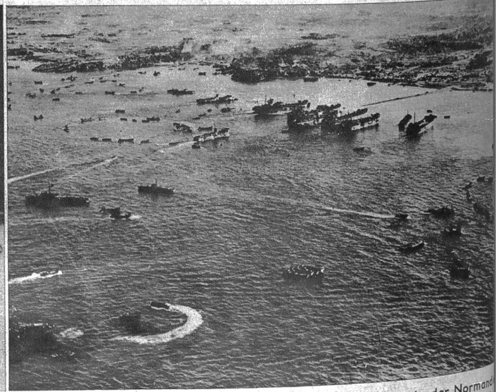
Der „Tag D“ für Japan scheint, wie dies bei der Invasion in der Normandie der Fall war, bereits definiert zu sein, und man erwartet lediglich noch eine Auswirkung der Konferenz der „Grossen Drei“ und eine Kapitulationsforderung, bevor zum endgültigen Zuschlagen geschritten wird. Dass hier alle Vorbereitungen getroffen sind, geht aus unserem Bild hervor, das eine der Invasionsflotten, an der Küste der Insel Okinawa konzentriert zeigt