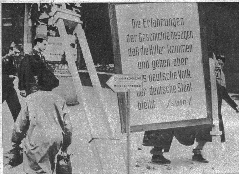
Stalin spricht zu den Berlinern. Als die Russen in Berlin einzogen, brachten sie allenthalben grosse Propagandaplakate an, auf denen meistens Sätze aus Reden von Stalin zu lesen sind. Die Briten und Amerikaner haben inzwischen die in ihren Sektoren befindlichen Anschläge wegbringen lassen. Wir zeigen hier einen der vielgenannten Stalinschen Sprüche