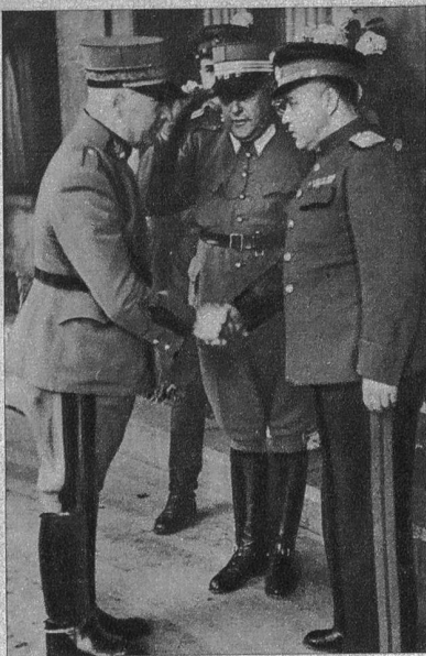
Die sowjetrussische Militärdelegation, insgesamt 20 Personen, ist in der Schweiz eingetroffen, um über die Frage der Internierung und Heimtschaffung der 10 000 russischen Militär- und Zivilinternierten und Flüchtlinge zu verhandeln. Unser Bild zeigt den russischen Delegationschef, General Witschorew im Gespräch mit Oberstdivisionär Flückiger und Oberst Genevière (Mitte), die die in Genf eingereisten russischen Offiziere nach Bern geleitete