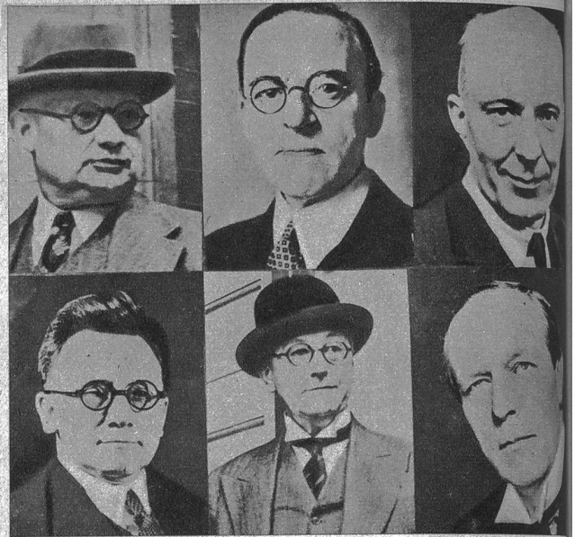
Das Labour-Kabinet. Premierminister Attlee hat König Georg seine Minister vorgestellt, die den Amtseid leisteten und die Amtssiegel in Empfang nahmen. Es sind dies, je von links n. rechts, oben: Aussenminister Bevin, Handelsminister Sir Stafford Cripps und Schatzkanzler Hug Dalton; unten: Lordpräsident und Führer des Unterhauses Herbert Morrison, Lordsiegelbewahrer Arthur Greenwood und Sir William Jowitt