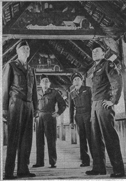
Die ersten amerikanischen Urlauber haben ihre Bewunderung für alles, was sie in den ersten Stunden ihres Schweizeraufenthaltes zu sehen bekamen, begeistert ausgedrückt. Die Soldaten, die in Nordfrankreich noch immer täglich das Bild von Elend und Kriegsverwüstungen vor sich haben, zeigten Interessen, die man kaum bei ihnen vermutet hätte. So besichtigt dieses flanierende Quartett eingehend die Gemälde in der gedeckten Kappelbrücke in Luzern