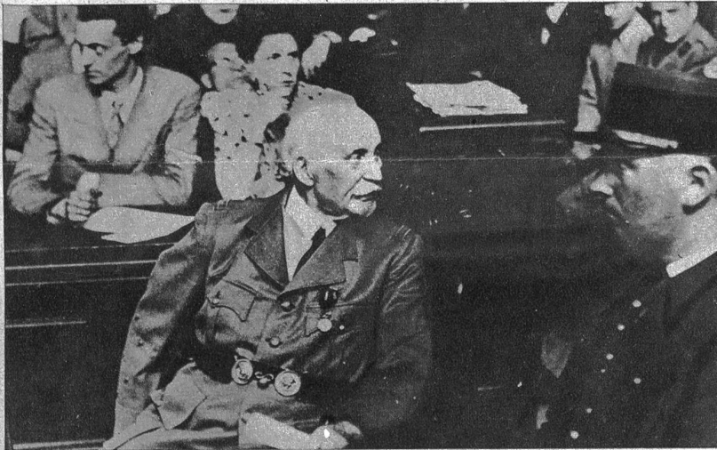
Links: Marschall Pétain, als Held von Verdun gefeiert, als Retter der höchsten Not 1940 herbeigeholt, dann — scheinbar — Frankreichs mächtigster Mann, steht heute als Angeschuldigter des Hochverrats im grössten Prozess Frankreichs. Fast neunzigjährig, bleibt seine Haltung die eines Marschalls von Frankreich. Aber auf die vielen Fragen, die an ihm gerichtet werden, antwortet er nicht. Er erklärt höchstens, nichts gehört zu haben... Aus „vive Pétain“ ist „Pétain au poteau“ geworden