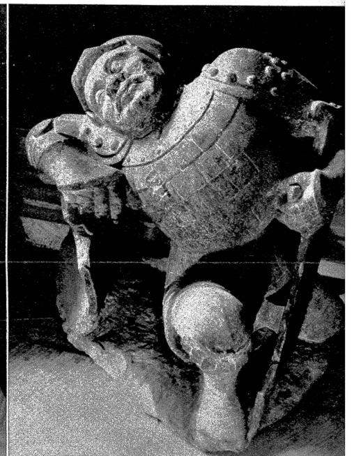
Der Soldat in tiefem Schlaf. Mit der Linken hält er das Schwert, mit der Rechten den Schild

den Träumen der Jugend nach. Wenn sich unsere Blicke trafen, erröteten wir und wurden ganz verwirrt. Kindliches Erschrecken durchzuckte uns, wenn unsere Hände einander berührten. Ich liebte Maria. Ich hätte ihr am liebsten meine grosse Liebe durch etwas Unerhörtes beweisen mögen. Wenn ich aber Maria streichelte oder meinen Arm um sie legte, zuckte sie zusammen, ihr Blick verdunkelte sich, und alles in ihr wehrte sich gegen mein jugendliches Ungestüm. Ich sah sogar, dass in ihren Augen vor holder Verwirrung Tränen glühten.