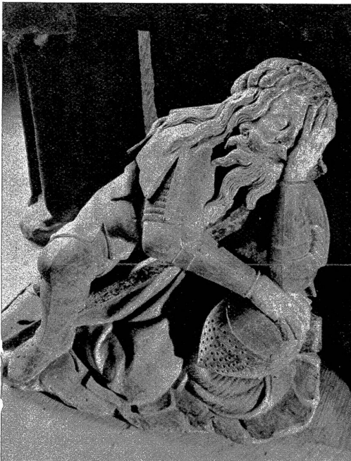
Der ganze Körper ist über den Speer gelehnt. Der eingeschlafene Soldat stützt sich auf seinen Helm