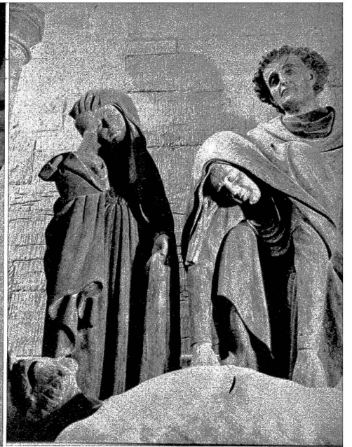
Der Hl. Johannes und die Hl. Jungfrau. Die grosse Trauer zeigt sich in allen Zügen und ist künstlerisch vollendet dargestellt