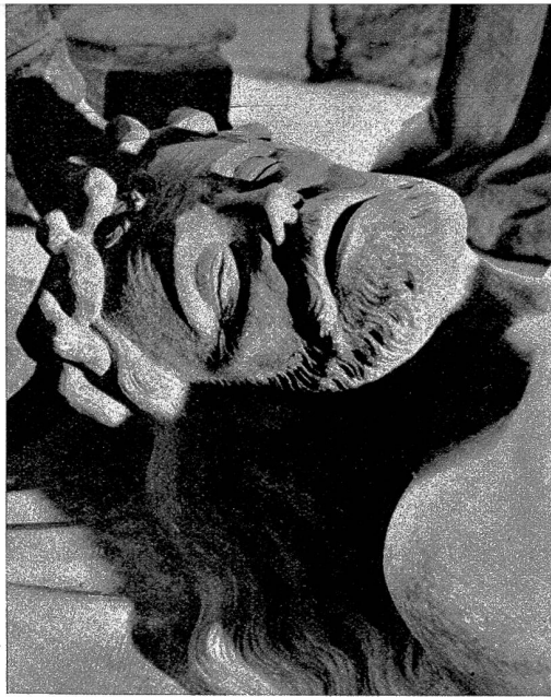
Der Oberkörper Christi mit dem schmerzverzerrtem Gesicht. Auf dem Haupt die Dornenkrone

Alle diese Statuen sind in natürlicher Grösse und wurden in Sandstein gehauen. Der Künstler ist unbekannt: das Grabmal trägt die Jahreszahl 1433.