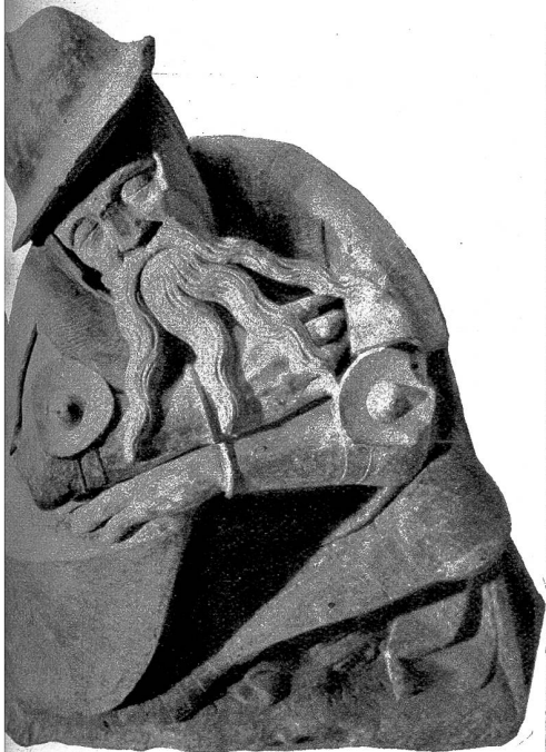
Die Grabwache. Ein Soldat im Dienste zu Rom gealtert, hält sein Schwert vor seine Brust. Trotz dem entschlossenen und strengen Ausdruck schläft er und neigt sich über seinen Schild