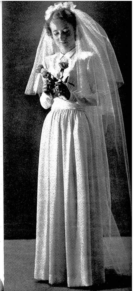
Die Couture-Firma E. Flückiger Bern, hat in bewundernswürdiger Weise für ihre Kunden vorgesorgt. Schönste Stoffe aus reiner Woll stehen bereit, um zu eleganten, sorgfältig ausgeführten Kostümen und Mänteln verarbeitet zu werden. — Unser Bild zeigt ein weisses Hochzeitskleid aus Seide, Modell E. Flückiger.

Eine sehr schöne Kollektion an Pelzmänteln weist auch die Firma Hilfiker-Dunkelmann , Kramgasse, Bern, auf, die sich die Mühe gegeben hat, ausser seltenen ausländischen Fellen, vor allem die einheimischen Pelztiere in neuartiger, besonders geschickter Art zu verarbeiten. Diese Mäntel sind nicht sehr teuer und wirken durch die raffinierte Verarbeitung doch ausserordentlich elegant.