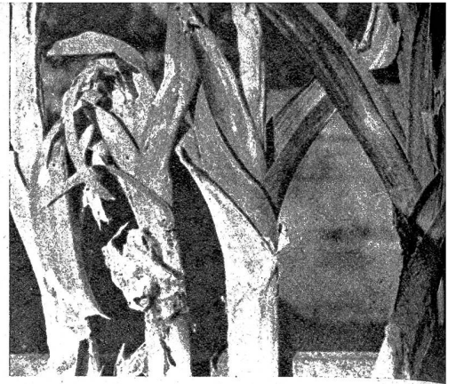
Schaden der Lauchmotte

Pflanzen ganz gehörig mit Gesarol durchstäubt. Wer das Bestäuben aber vom Juli an periodisch durchführt, braucht keine Operation vorzunehmen; ich habe das seit Jahren bei meiner Lauchpflanzung feststellen können. Der Sellerie wird von einem Pilz befallen, welcher die Weissfleckenkrankheit erzeugt. Dabei werden die Blätter dürr und kaum haben wir sie entfernt, sind die innern, neu gebildeten Blätter auch schon erkrankt und sterben ab, und mit der Knollenbildung ist es aus und amen; denn nur im gesunden Blatt können neue Aufbau- und Reservestoffe gebildet werden. Je mehr gesunde Blätter eine Pflanze besitzt, desto grösser ist die Produktion und damit auch der Ertrag, ganz besonders dann, wenn durch richtige Pflanzweite dafür gesorgt wurde, dass alle Blätter belichtet werden konnten. Auch der Sellerie ist ganz besonders im September noch gefährdet; darum auch jetzt noch, ohne zu erlahmen, ihn mit kupferhaltigen Präparaten bestäuben oder bespritzen; das letztere ist bedeutend wirksamer.