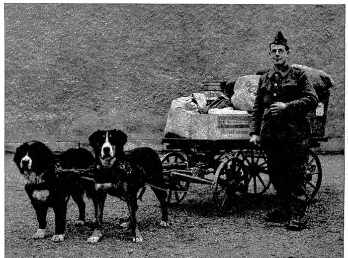
Rechts: Dürrbächler und Grosser Schweizer Sennenhund besorgen zuverlässig den gesamten Nachschub eines Truppenteiles

Nach ging er in der Weste herum, die ich ihm gezeigt hatte und nichts wäre uns zuviel gewesen, diesem treuen Tier wieder aufzuhelfen. Der Arzt aber sagte, er hätte Flechten, die immer wieder ausbrechen würden und für meine kleine Schwester, die eben in seiner Grösse war, eine gewisse Gefahr bedeuteten. Darum wurde mein Vater schlüssig, ihm ein gutes Ende zu bereiten. Wie aber, das war die Frage, nach dem schon an sich fassen Entschluss. Ihn weggeben, ihn irgend einem Schlächter überlassen, der ihn ohne Wissen um seine Verdienste wie irgendeinen herplanzenen „Baster“ handwerksmässig abtat — das schien uns feige und unwürdig. „Mir vertraut“, sagte mein Vater, „von mir wird er alles