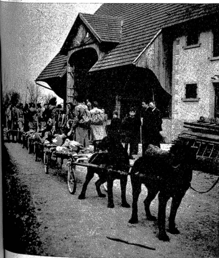
Links: Rottweiler als Traktionshunde