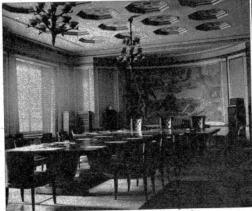
Blick in den grossen Sitzungssaal