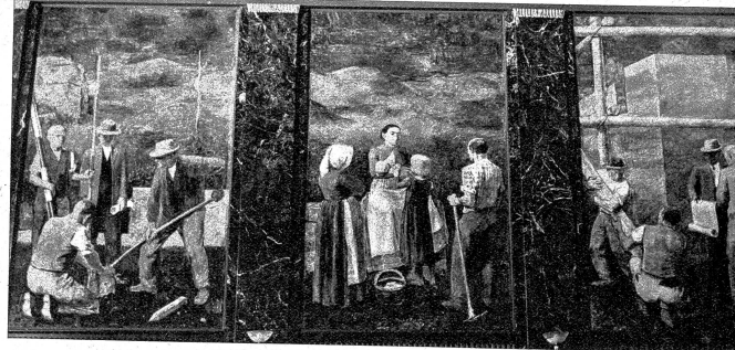
Wandmalereien im Plenarsaal

Die Wurzeln des auf der Bundesverfassung von 1874 beruhenden Gesetzes über die Bundesrechtspflege vom Jahr 1875 und damit des ständigen Bundesgerichtes gehen verhältnismässig nicht tief. Sie reichen nicht weiter als bis zum Jahr 1848 zurück. Es ist dies sehr natürlich, weil das Bestehen des Bundesgerichtes seiner inneren Beschaffenheit nach erst mit der Umbildung des Staatenbundes in einen Bundesstaat gerechtfertigt wurde.