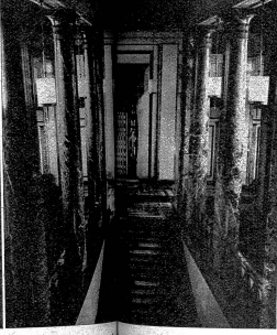
Der Treppengang zum Bundesgerichtsgebäude mit dem grossen Gerichtssaal