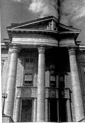
Der Eingang zum neuen Bundesgebäude