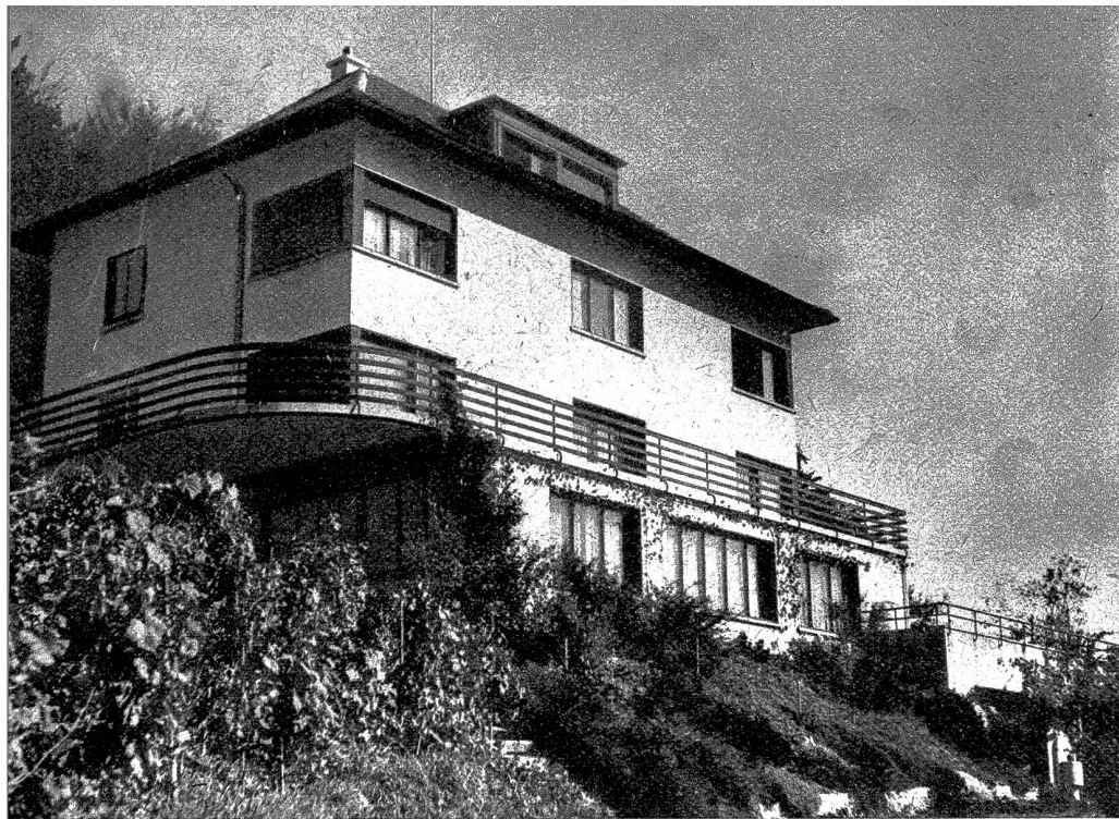
Ansicht des Bürogebäudes der Firma A. Gerber & Cie. AG. in Lyss

D ieser Ausspruch aus dem 17. Jahrhundert hat heute die gleiche Geltung wie anno dazumal. In jedem Gewerbe oder Handelsunternehmen ist die Zeit massgebend, und bei Unternehmungen, welche noch dazu mit rasch verderblicher Ware in nützlicher Zeit die Verteilung vornehmen müssen, gilt das Gebot der Zeit doppelt. Früh beginnen, rasch handeln und gewissenhaft arbeiten ist noch heute der Grundsatz der Firma Gerber, die in relativ kurzer Zeitspanne ihre Bewährung unter Beweis stellen konnte.