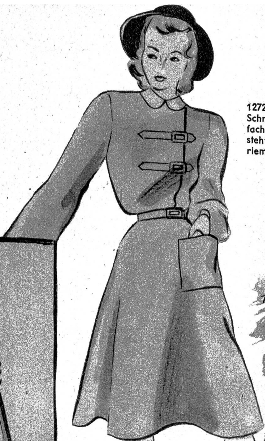
1272. Der einzige Schmuck dieses einfachen Kleides besteht aus zwei Strapsen mit Schnalleverschluss