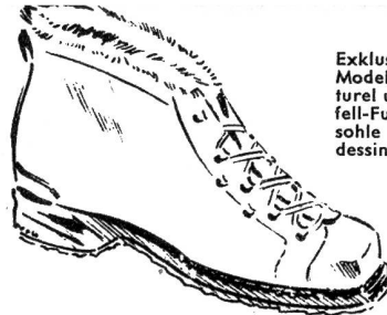
Exklusives Après-Ski-Modell, in Veau naturel und echt Lammfell-Futter, BMP-Laufsohle mit Clipperdessin