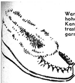
Warmgefütterter, halbohoher Hausschuh mit Kaninbesatz und kontrastfarbiger Schnürrgarnitur