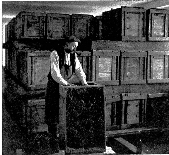
Die jungen Veredlungen werden in Kisten geschichtet und in den Vortreibraum gebracht