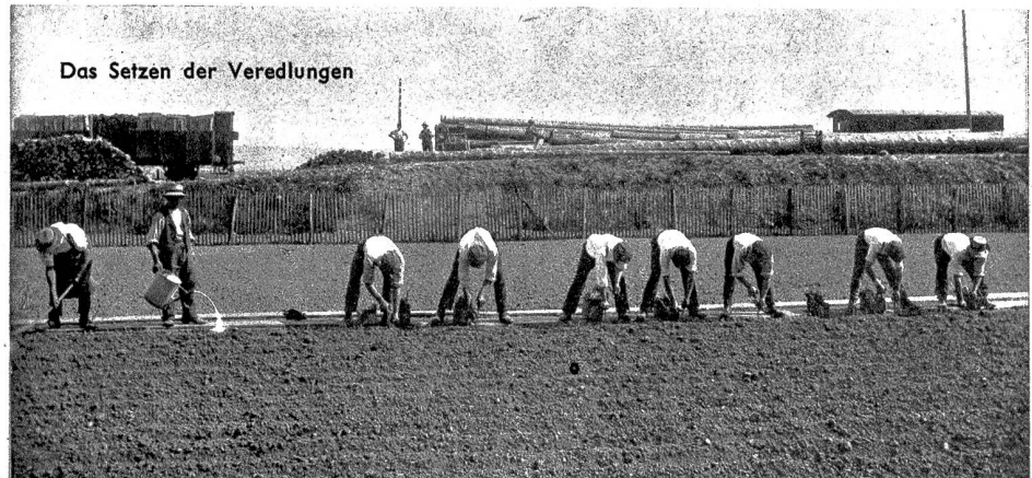
Das Setzen der Veredlungen