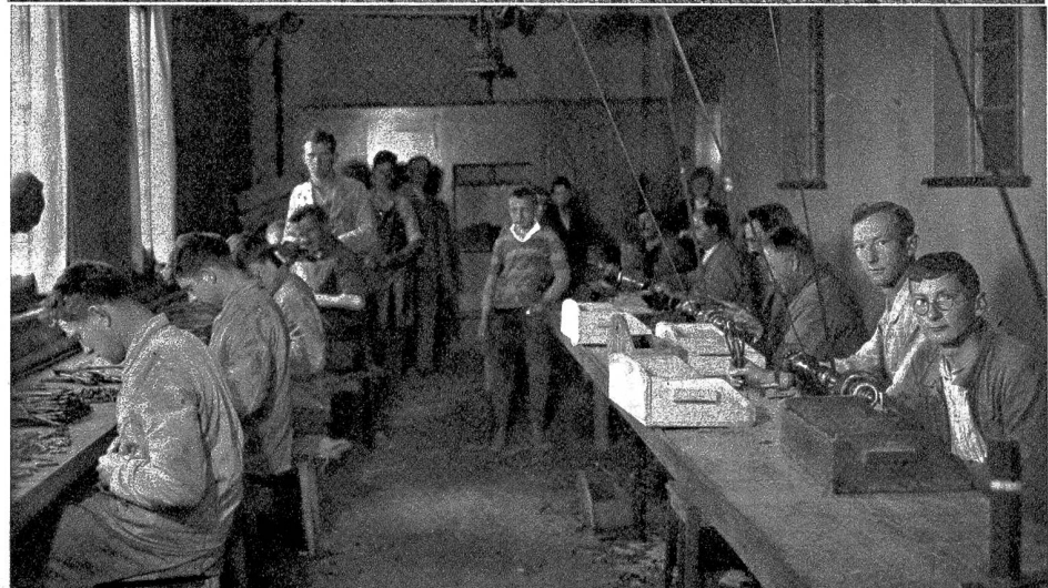
Pfropfer an der Arbeit