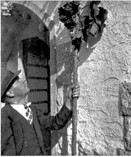
Zweijährige, vielversprechende Spalierrebe

«Wie viele, die das flüssige Gold oder den Purpursaft edlen Weines schlürfen, haben eine Ahnung, was alles dazu gehört, was alles sein Teil dazu tragen muss, damit Sonne und Erde in die Köstlichkeit eines solchen Trunkes sich wandeln? Sollte es aber nicht eher zu unserer Bildung gehören, die Vorgeschichte eines Glases heimischen Weines zu kennen als die Geschichte der ägyptischen Pharaonen?