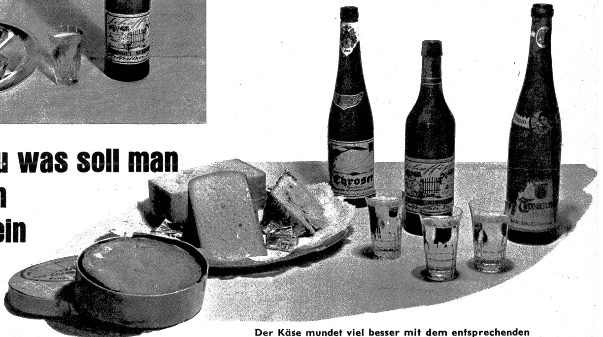
Der Käse mundet viel besser mit dem entsprechenden guten Tropfen