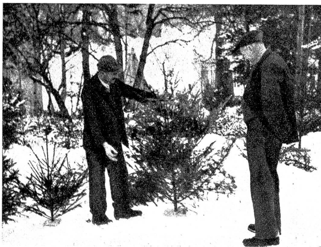
Morgen ist Weihnacht

Los, wi d'Buebe dāne rumore? Sie wei ds Bäumlü zwäg-mache — sie wei Wiehnachte ha! Schön rot Öpfle het me ne ggä — die verguldete Nüss, Silberfāde. Der Köbi singt. Eis Schuelliedli nam andere schmätteret er use. «Alle Jahre wieder, kommt das Christuskind.» Guete Bueb! — U sie — cha sie Wiehnachte fyre? Cha sie sech freue? Cha sie tue, wi we nüt wär? Cha sie em Roseli froh i d'Ouge luege —