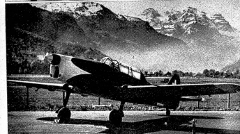
Aus den Pilatusflugzeugwerken in Stans ist soeben das neue Schweizer Schulungs- und Trainingsflugzeug «Pilatus P 2» übernommen worden. Es handelt sich um einen einmotorigen, zweiplatzigen freitragenden Tiefdecker einer einfachen und sehr robusten Konstruktion, der eine Schnelligkeit von 340 Stundenkilometer erreicht.