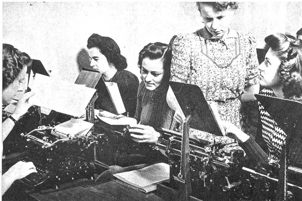
Uebungen nach der 10-Finger-Schreibmethode