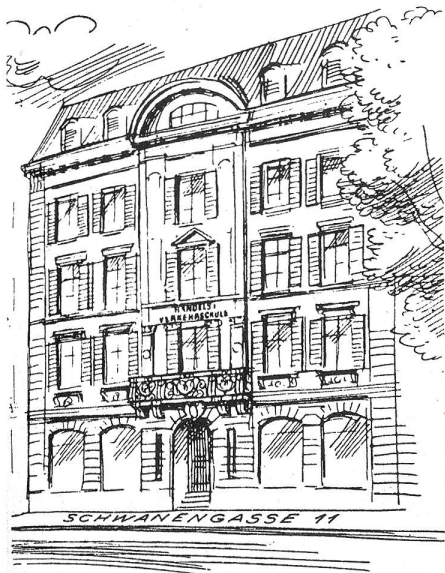
Handels- und Verkehrsschule Schwanengasse 11, Bern