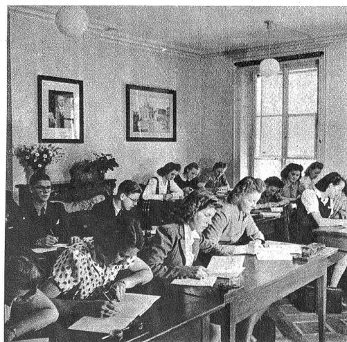
Praktische Uebungen dienen der Festigung des Lehrstoffes

Die grosse volkswirtschaftliche Bedeutung der Privatschulen hat sich in den letzten Jahren aufs neue erwiesen. Die Privatschule ist beweglich, anpassungsfähig und lebensnah. Mit Vorteil holen sich die jungen Menschen das Rüstzeug für die Zukunft in einer bewährten Privatschule.