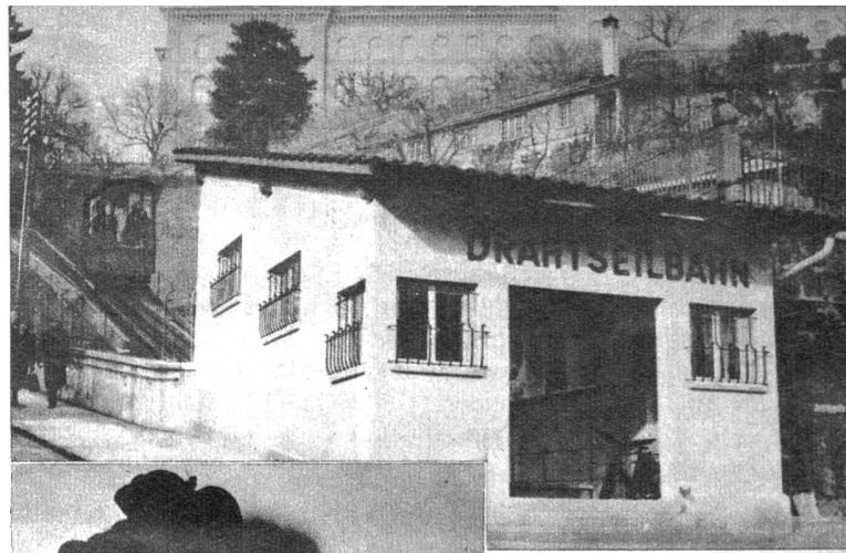
Oben: Die kleinste Drahtseilbahn der Welt, das Marzili-Bähnli in Bern, hat einen neuen „Bahnhof“ erhalten, und zwar an der Talstation. Der Verkehr auf dem Marzili-Bähnli ist 1945 auf mehr als das Doppelte früherer Jahre angewachsen und übersteigt 600 000 Passagiere (ATP)

So sagten die Journalisten. Sie fügten bei, dass sie in acht Tagen wohl zehntausend Toasts auf die alliierte Zusammenarbeit und alles mögliche bringen mussten, ferner, dass sie von den Russen fast zutode gefüttert und getränkt wurden; als eigentliche «Opfer der russischen Gastfreundschaft» wären sie schliesslich völlig erschöpft wieder in Berlin eingetroffen. An diesen Umstand haben natürlich die Zweifler verschiedene Fragen geknüpft, zum Beispiel, wie die Amerikaner in diesem Zustande die peinliche Respektierung der Gewissenhaftigkeit in Sachsen konstatieren konnten. Wir Schweizer werden mit unserm Urteil zurück-