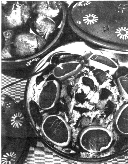
Sauerkraut mit Steinpilzen und Schinken