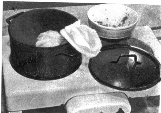
Im Tuch kocht der Pudding etwa 15 bis 20 Minuten