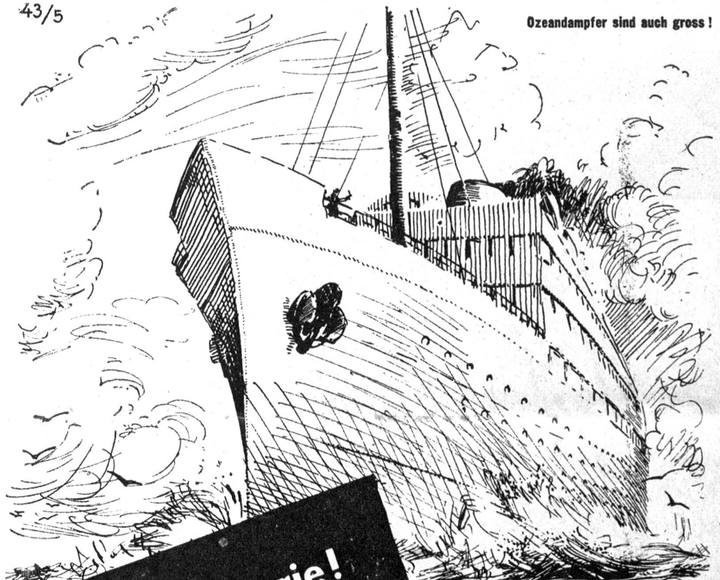
Ozeandampfer sind auch gross!